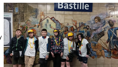
L'équipe "La Truite" de Donzy

L'équipe de "La Truite" composée d'élèves de 6ème du Collège Henri Clément qui avaient remporté la finale du Rallye citoyen organisé par la ville de Cosne, en partenariat avec EducapCity, sont partis pour deux jours à Paris. Au programme : visite de la ville et rallye. De beaux souvenirs en perspective.