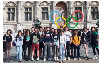
Remise des prix à Paris Mercredi 24 mai 2023 Bravo à tous les élèves