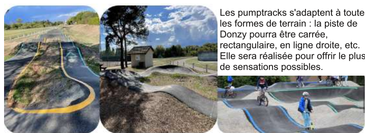
Les pumptracks s'adaptent à toutes les formes de terrain : la piste de Donzy pourra être carrée, rectangulaire, en ligne droite, etc. Elle sera réalisée pour offrir le plus de sensations possibles.

Nous vous remercions de bien vouloir répondre au questionnaire joint avant le 30 janvier 2023.